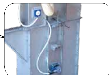
Snímače vybočení pásu a snímače otáček