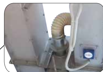
Odprašovací přípojka v patě