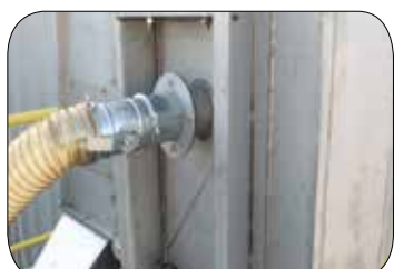
Odprašovací přípojka v hlavě