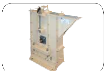
Nízkozbytková patní sekce