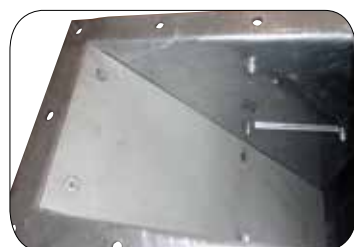
Protiotěrové ochranné štíty