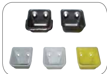
Široké spektrum korečků